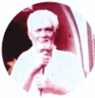
සිවලෝගපිල්ලෙයි සේකුකවලප්පල්ලෙයි වෙනත් අනුග්‍රාහකයා 1936 සිට 1966 දක්වා

අනාගතය දෙස බලන විට, වගකීමේ යෂ්ටිය වෙල්ලපා මුරුගේසුගේ දක්ෂ දැත් වෙත මාරු වීමට නියමිත අතර, ඉන් පසුව, උරුමය ආරක්ෂා කිරීමට සහ මෙම ගෞරවනීය සම්ප්‍රදායේ බාධාවකින් තොරව අඛණ්ඩ පැවැත්ම සහතික කිරීමට සූදානම්ව සිටින මුරුගේසු සිවලෝග නාදන් සහ සුප්පියා උදයශෝති. උත්සවයේ සාරය ආරක්ෂා කිරීම සඳහා ඔවුන්ගේ කැපවීම ඔවුන්ගේ පෙළපත තුළ මුල් බැසගත් සංස්කෘතික උරුමය කෙරෙහි ගැඹුරු ගෞරවයක් මුර්තිමත් කරයි.