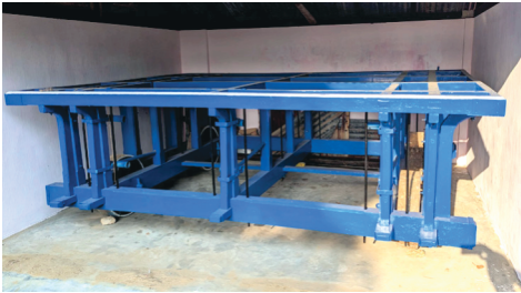
1939 අප්‍රේල් මාසයේදී ඉදිකරන ලද වස්තූන් කරත්තය සහ 2023 මැයි මාසයේදී නැවත නිත්ත ආලේප කරන ලදී.

ශුද්ධ සැරසිලි සඳහා කුඩා අරමුදලක් පිහිටුවා ඇති අතර, 2023 දී ලෝගන් නානන් (මුරුගේසු සිවලෝගනාදන්) විසින් ප්‍රතිසංස්කරණය කරන ලද වස්තූන් කරත්තය සහ මයිවාකනම් ඇතුළු දේවමාලිගාවේ යටිතල පහසුකම් නඩත්තු කිරීමට සහ ප්‍රතිසංස්කරණය කිරීමට උත්සාහ දරා ඇත.