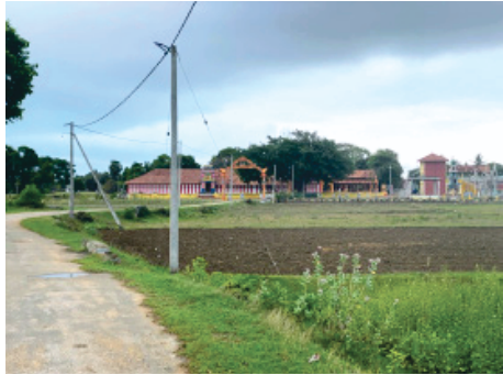
වුලිපුරම් යුනිට්වේ සහාය ඇතිව කුඹුරු පිටිපුරම් සිට විනයාගර් කෝවිල දක්වා සකස් කරන ලද මාර්ගය.

තවද, සනාගල් ස්වාමීගේ උත්සාහය පුළුල් ලෙස පිහිටුවීමට හේතු විය කන්නකායි අම්මාල් කෝවිලේ සිට විනයාගර් කෝවිල දක්වා වූ අඩිපාර වෙට්ටිපිල්ලේ. අතිරේකව, සංකරපිල්ලේ රාමනාකර් චිතිවිධංගර් පේදුරුකුඩුව සිට කාංසෙනතුරේ දක්වා වෙරළ තීරෙ මාර්ගයක් ඉදි කළේය වුලිපුරම් තිරුවඩිනිල්ලයි, බ්‍රාහ්මණ, ගෞවයන්ගේ සොහොන් බිමට සම්බන්ධ කිරීම, සහ වේලාලර් තිර්ථ කරෙයි (ශුද්ධ නාන ස්ථානය) දකුණින් පිහිටා ඇත.