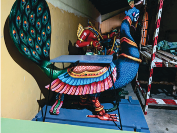
1939 අප්‍රේල් මාසයේදී ඉදිකරන ලද මයිවාකනම් ප්‍රතිසංස්කරණය කර 2024 මැයි මාසයේදී අලුතින් ප්‍රතිසංස්කරණය කරන ලදී.