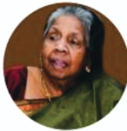
සරස්වතී දේවී මුරුගේසු වෙනත් අනුග්‍රාහකයා 1982 සිට 2010 දක්වා